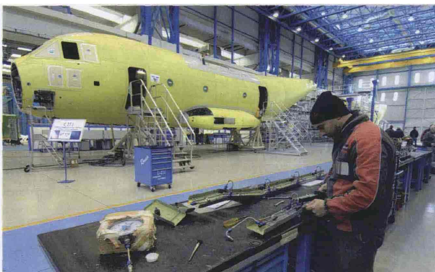
OPERAI AL LAVORO IN UNO DEI TRE STABILIMENTI ALENIA DELL'AREA DI NAPOLI