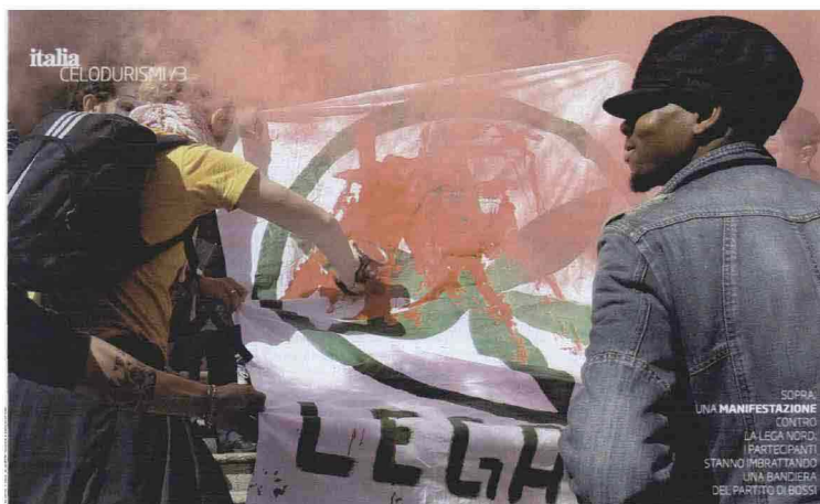
SOPRA: UNA MANIFESTAZIONE CONTRO LA LEGA NORD. PARTICIPANTI STANNO MONTANDO UNA BANDIERA DEL PARTITO DI BOSSI

Il Sud ha risorse e uomini nuovi, ma il rischio è che li fermino: come Falcone e Borsellino